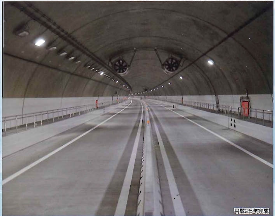
東九州道(蒲江~県境)葛原トンネル北工区舗装工事 (国土交通省 九州地方整備局長 表彰)