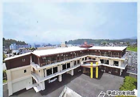
花月園新築工事(鉄筋コンクリート造/2184㎡)