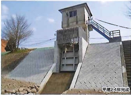
筑後川中大山樋管工事