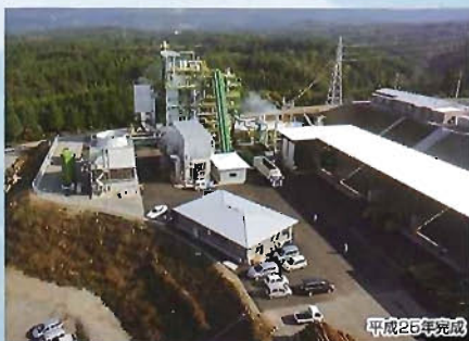
天瀬発電所新築工事