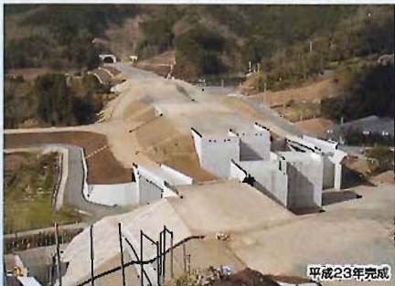
東九州道(蒲江~県境)森崎地区第3工区改良工事 (国土交通省 佐伯河川国道事務所長 表彰)