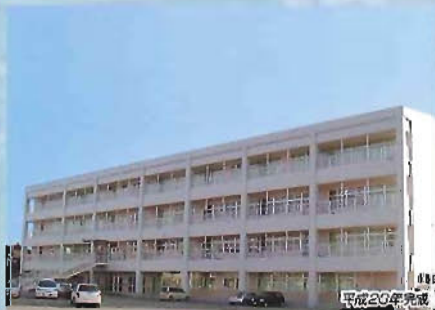
日田市立三隈中学校新增改築工事(鉄骨造/6491㎡)