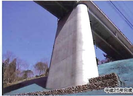
赤谷橋 橋梁補修工事