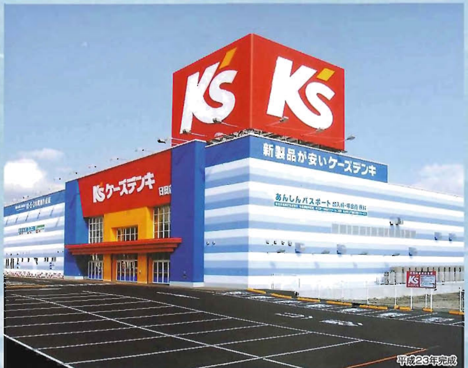
ケース電気日田店新築工事(鉄骨造/3937㎡)