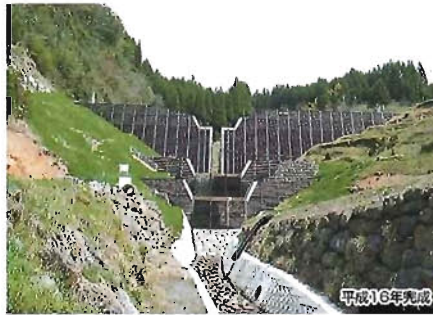
砂防工事 落水砂防ダム工事