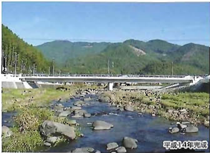
橋梁工事 明德橋架替工事 (国土交通省 九州地方整備局長 表彰)