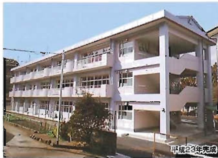
南部中学校校舎新築工事(鉄筋コンクリート造/2096㎡)