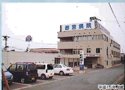
若宮病院新築工事(鉄筋コンクリート一部鉄骨造/1923㎡)