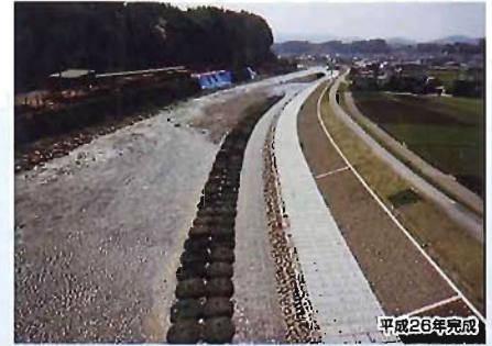
花月川三和地区掘削護岸災害復旧工事