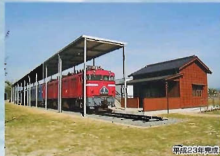
ブルートレイン駅舎工事(鉄骨・木造/282㎡)