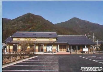
小野公民館新築工事(木造/401㎡)