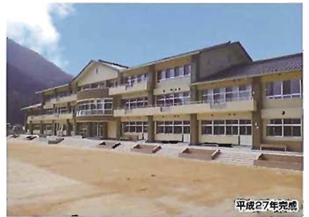
大山小中学校(鉄筋コンクリート造/3654㎡)