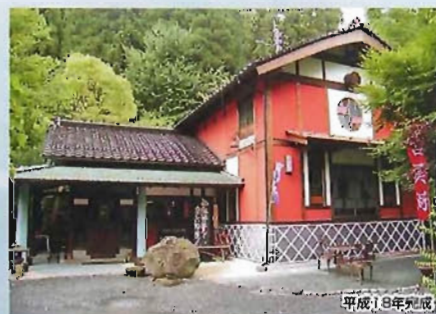
琴平ギャラリー棟新築工事(木造/105㎡)