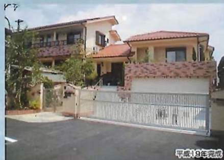
W邸新築工事(木造一部鉄筋コンクリート造/337㎡)