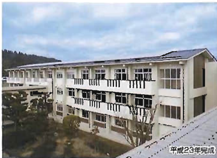
日田林工校舎新築工事(鉄筋コンクリート造/1920㎡) (大分県 工事検査室長 表彰)