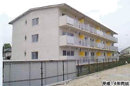
日田宿舎新築工事(九州郵政局)(鉄筋コンクリート造/857㎡)