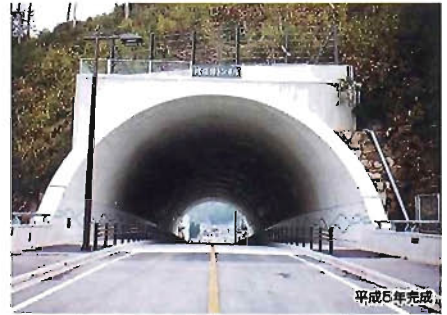
トンネル工事 比佐津トンネル工事