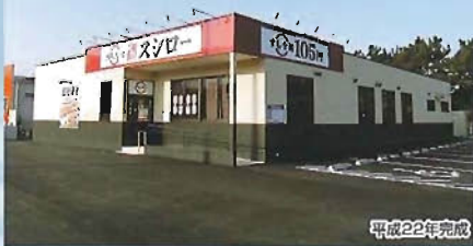
スシロー八幡黒崎店新築工事(木造/334㎡)