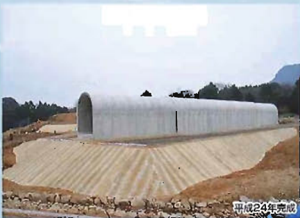
三光本耶馬渓道路函渠設置工事